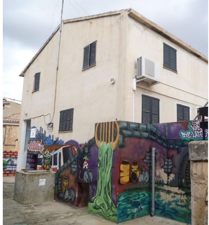
Vista del inmueble desde la fachada del patio posterior.