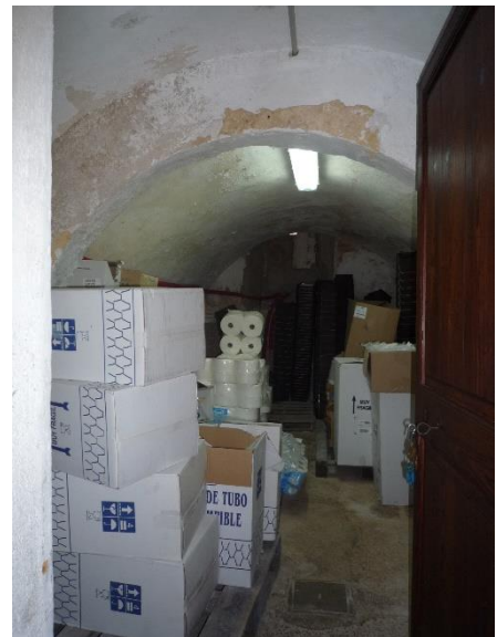
Vista interior del inmueble.