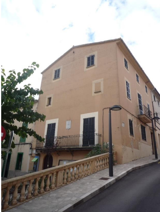
Vista del inmueble desde la Plaça Bernat de Santa Eugènia.