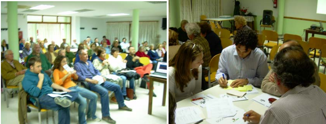
Imatge 1 Presentació dels punts forts i febles de 2007.